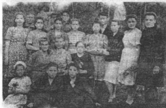
Сотрудники Каменского детского дома. Май 1949 года