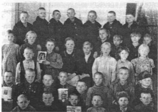
Воспитанники Першинского детского дома. 1958 год.