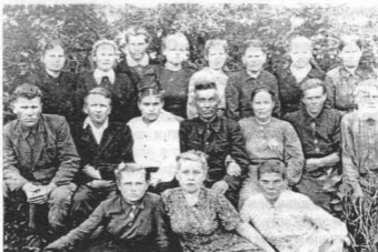
Сотрудники Коряковского детского дома. 1951 год.

И вдруг я неожиданно нашла брата, разбогатела родней и возвратила свое отчество – Владимировна.