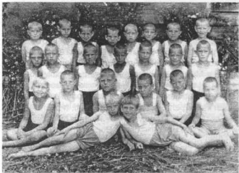
Воспитанники Серебрянского детского дома

Список хороших людей, вышедших из стен детских домов и нашедших свое призвание, большой. Только 60 человек из Макушинского детского дома продолжили свою учебу в училищах и техникумах. Многие из них получили высшее образование.