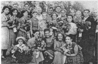
Встреча воспитанников Шатровского детского дома.

Сокровенные тайны свои, Так тянувшихся к Вашим рукам, Ждущих ласки, вниманья, любви. Вперемежку и отдых, и труд, Сенокосы, дрова, огород... Сколько было счастливых минут! Огорченья, обиды – не в счет. Мне запомнился праздничный бум, Блеск костюмов, артистов задор И восторженных зрителей шум, И гостей новогодний убор. Мы разъехались, слезы смахнув, И вошли в незнакомую жизнь. Вы ж, о нас потаенно вздохнув, Новых пестовать чад принялись.