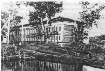
Родной Шатровский детский дом