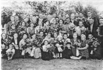
Встреча воспитанников Шатровского детского дома. 1960 год.