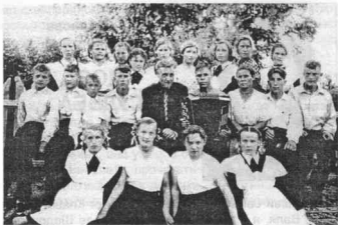
Дружный десятый класс. 1956 год.