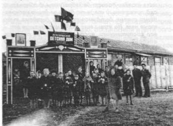
Серебрянский детский дом

Разместили детский дом в школе, а ту, соответственно, перенесли в бывшую церковь.