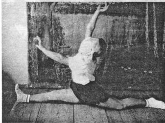
Акробатика – любимое занятие

вторым голосом, и у нас получился хороший дуэт. Совместные упражнения развивали музыкальный слух.